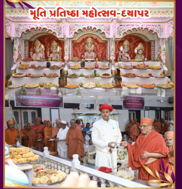
મૂર્તિ પ્રતિષ્ઠા મહોત્સવ-દયાપર