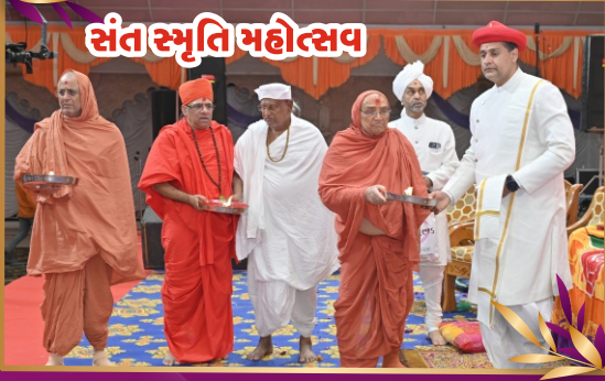
સંત સ્મૃતિ મહોત્સવ

प्रकाशन दर मासानी प तारीजे सणंग अंक ४५७, जन्वुआरी-२०२४, રૂ. ૫.૦૦/-