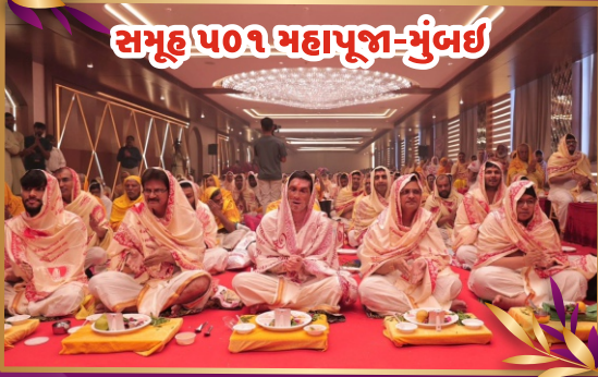
સમૂહ ૫૦૧ મહાપૂજા-મુંબઈ